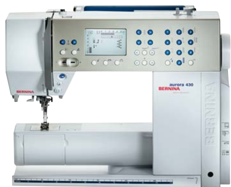
Bernina Aurora 430