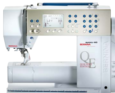
Bernina Aurora 440 QE